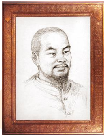
ตาขุนลก พระเสื่อเมือง เทพแห่งความอุดมสมบูรณ์

practitioner of the Buddha's teaching. So he was much revered by Buddhist lay men and women in both Nakhon Si Thammarat and the surrounding areas. His daily activities his life consisted of giving kindness and serving the local community such as building roads, stupas, ordination halls, congregation halls and schools. His unique character was to speak little but with much substance. For that he was known as the Monk with Infallible Words