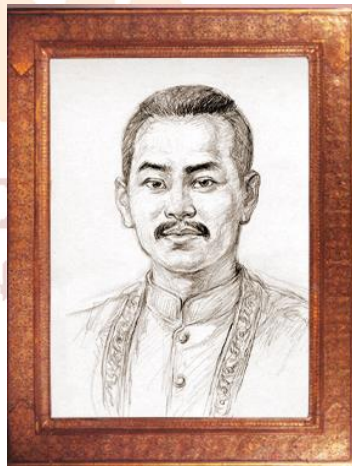
เจ้าพระนครศรีธรรมราช (น้อย)

King Chandrabhanu was the ๔ th King of the Patamawong (Pathumwong) dynasty who was in power for ๒๓ years from ๑๒๔๗ to ๑๒๗๐. The chronicles Mahavamsa of Sri Lanka state that he twice invaded the island during the reign of King Parakramabahu II. Inscription No.๒๔ in khmer scrips and is sankrit language highly praised King Chandrabhanu as the king of Righteous Law (Sithammaracha), comparing him to the great king Asoka of India.