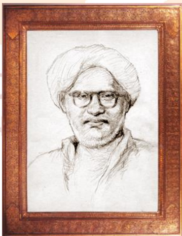
ท่านอาจารย์อัจริยะโกบ สุมาลี

Since he was respected by the people in the area, when he passed away the townspeople built a Ta Kun Lok Shrine at Mamuang Song Ton Village and a statue of ta Kun Lok at the City shrine. It is believed that worshipping this statue will bring a good rice harvest.